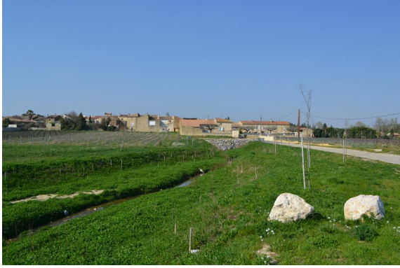
Plantation récente de ripisylve.