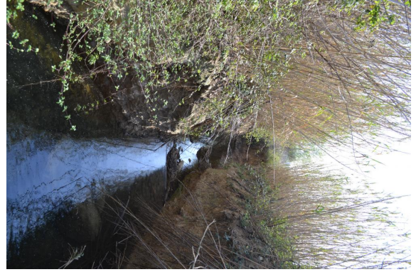
Cours d'eau incisé.