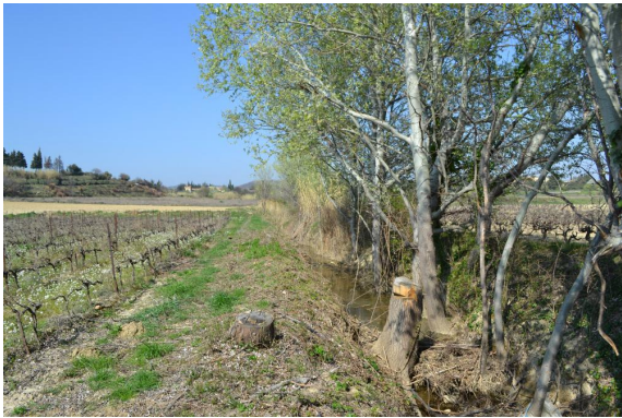
Coupe de ripisylve.