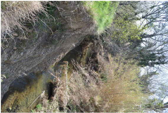
Cours d'eau incisé et berges érodées.