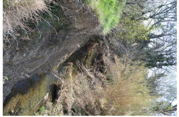
Cours d'eau incisé et berges érodées.