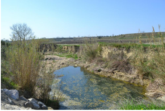
En amont du bassin écreteur, les berges sont très érodées et la ripisylve éparse.