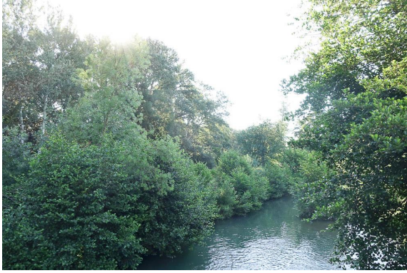
Vue générale de la ripisylve.