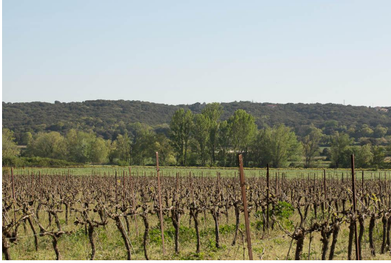
Vue générale de la ripisylve dans le contexte agricole.