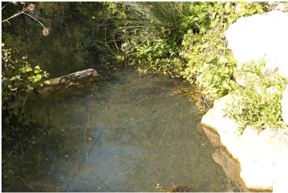
Mauvaise qualité d'eau.