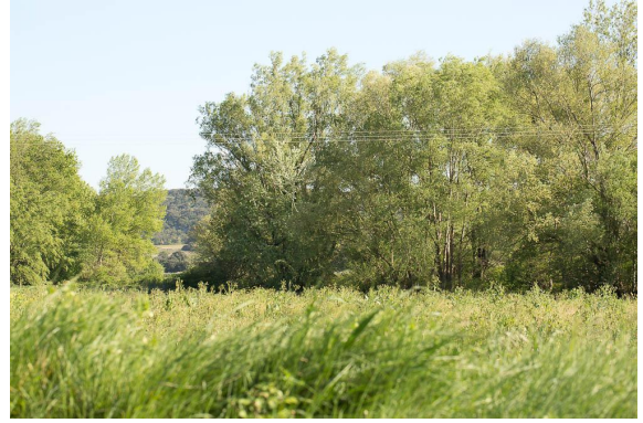
Vue de la ripisylve.