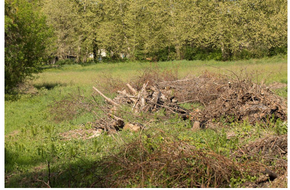
Dépôts sur la prairie.