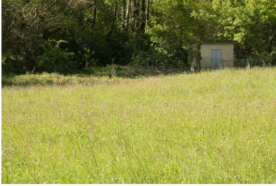
Prairie mésophile au premier plan, puis humide dans le creux ; ruisseau en fond.