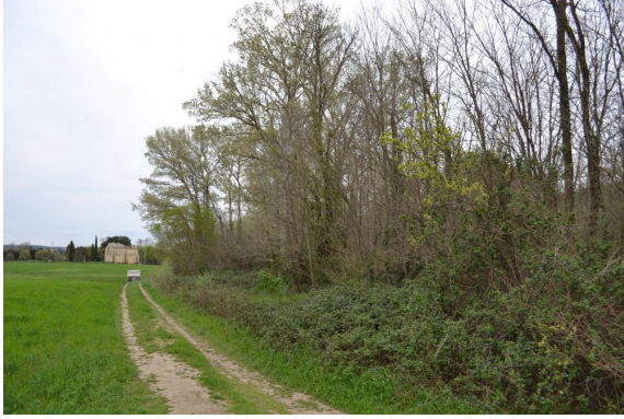
Ripisylve de Peupliers en contexte agricole.