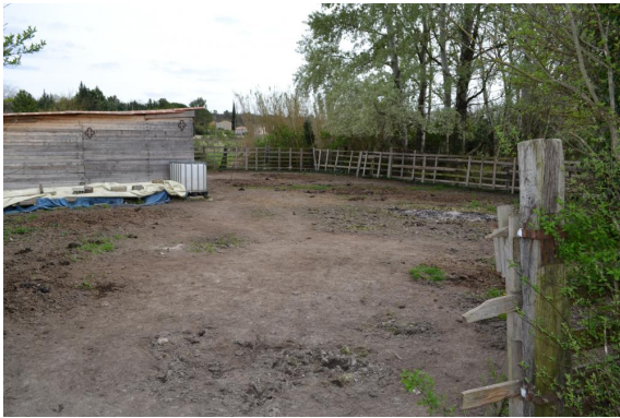
Zone piétinée aux confins de la zone humide au niveau de l'abri pour les chevaux.