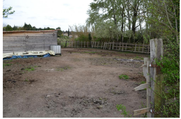
Zone piétinée aux confins de la zone humide au niveau de l'abri pour les chevaux.