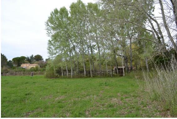
Ripisylve et prairie humide pâturée.