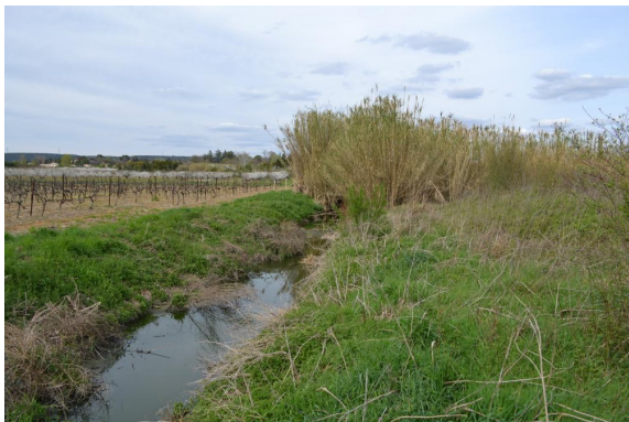
Cannier sur fossé.