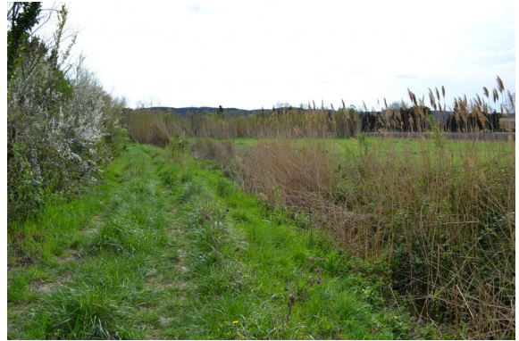
Roselière au niveau du fossé en aval de la STEP.