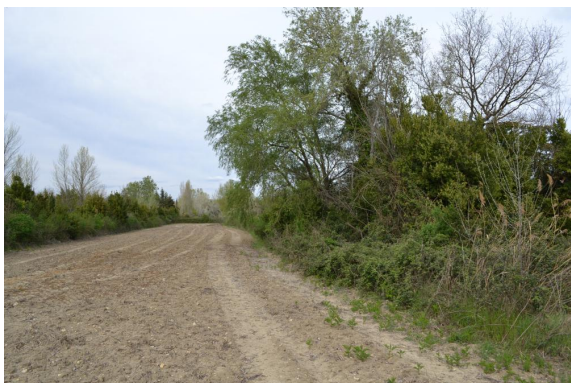
Saulaie sur cours d'eau canalisé en contexte agricole.