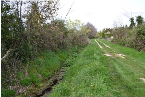
Fossé en aval du rejet de la STEP (lagunage).