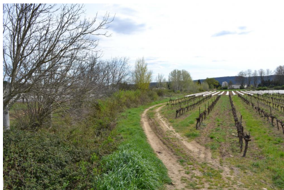
Ripisylve contrainte par les activités agricole sur fossé enrichi.