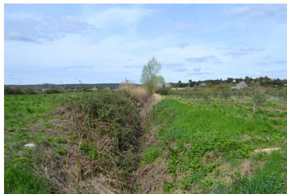
Fossé avec roselière enrichie.