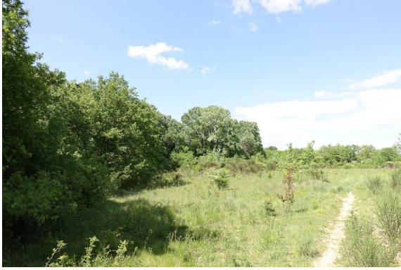
Vue de la ripisylve : les grands Peupliers blancs accueillent potentiellement un couple de Faucon hobereau.