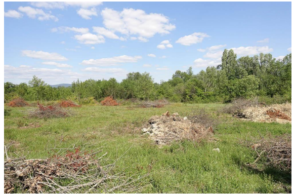
Entretien des parcelles au gré des réouvertures après abandon momentané.