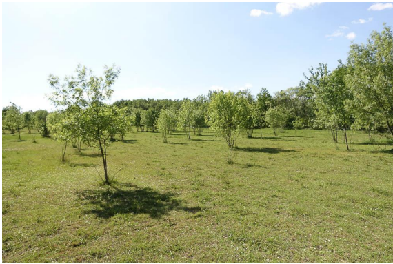
Vaste parcelle pâturée avec un boisement très lâche de Frêne.