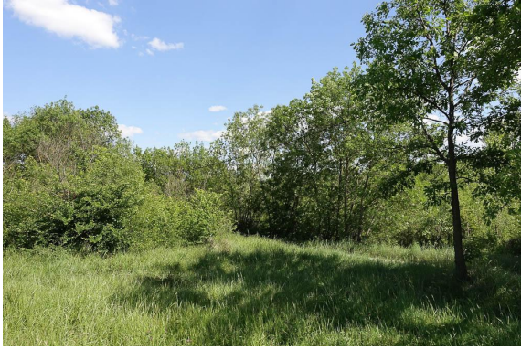
Aspect des frênaies entourant des prairies de fauche mésophiles.