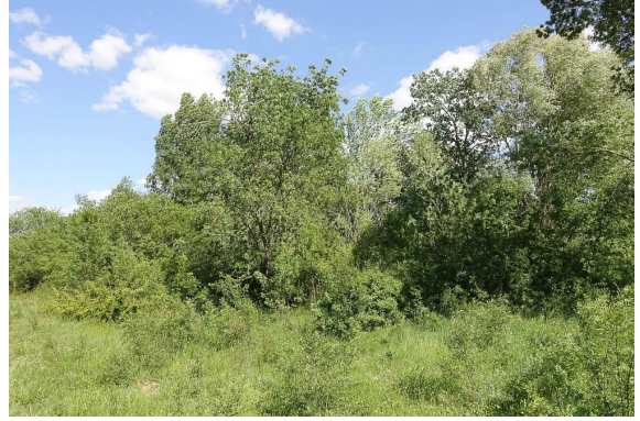
Vue de la ripisylve.