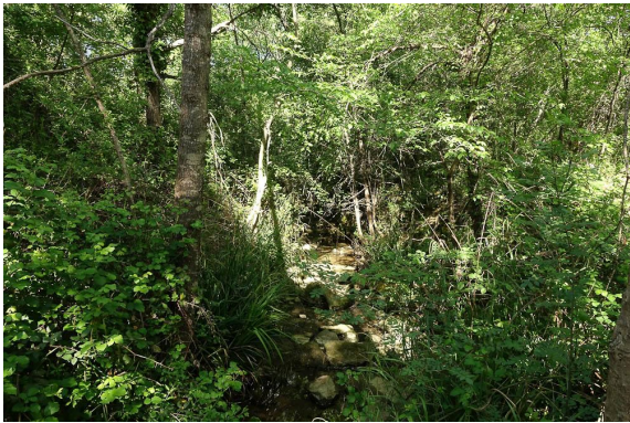
Autre vue de la ripisylve.