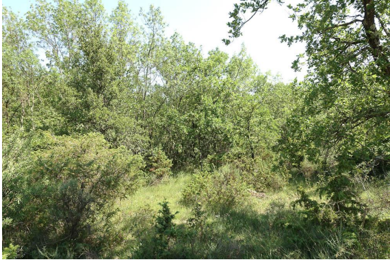
Vue de la Frênaie.