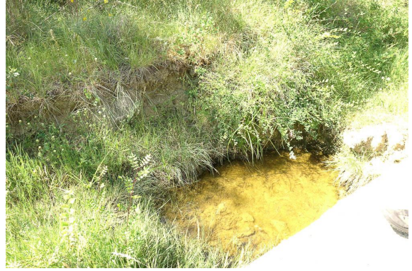
Résidu d'eau en bord de route.