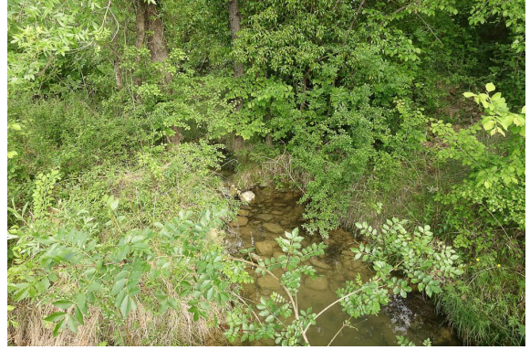
Cours d'eau temporaire.