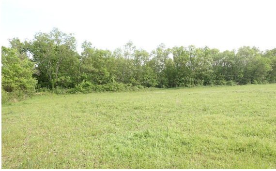
Vue sur la ripisylve dégradée en aval.