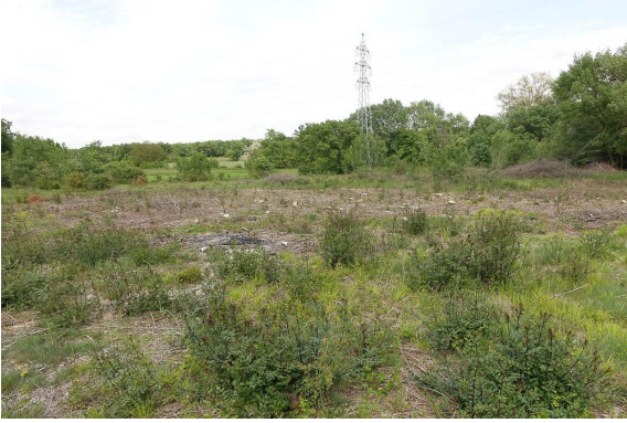
Vue générale de la "prairie humide" à très fort potentiel après coupe drastique de la ripisylve à Frêne.