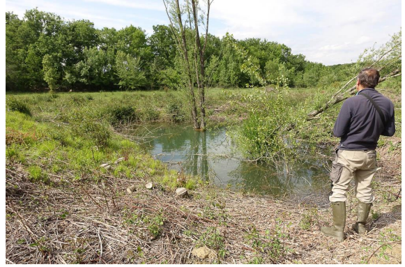
Trou d'eau en amont de pente de la prairie.