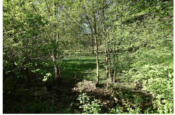
Clairière à Narcisses des poètes et Frênes.