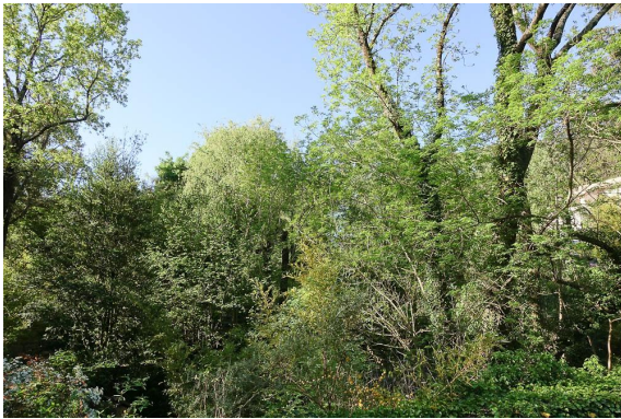
Ripisylve enchevêtrée dans le massif boisé.