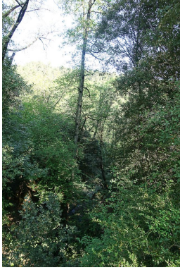
Ripisylve enchevêtrée dans le massif boisé.