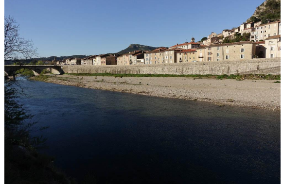
Le Gardon dans la traversée d'Anduze, en amont du pont routier.