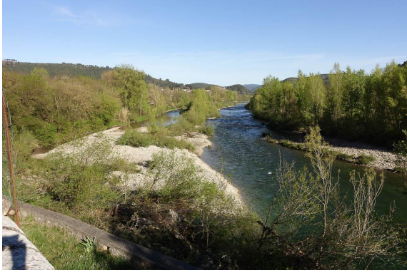
Vue sur la partie amont de la zone humide, avec un aspect "sauvage".