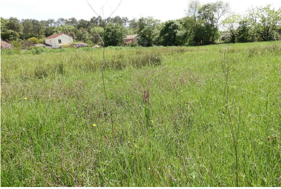
Orchis laxiflora et autres plantes des prairies humides.