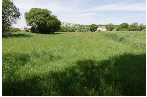
Vue générale de la prairie humide.