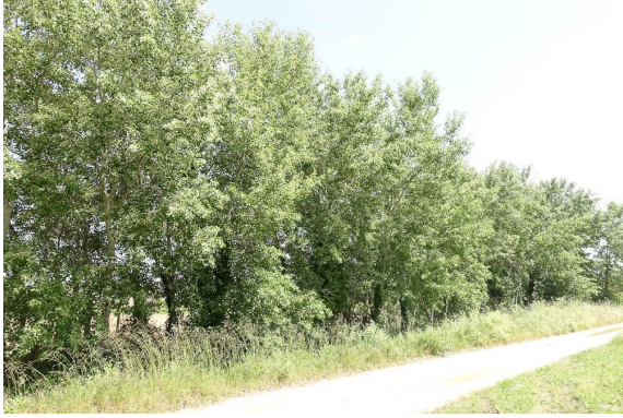
Cordon de Peuplier blanc.