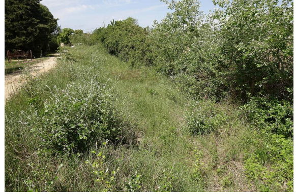
Fossé large et berges en pente douce.