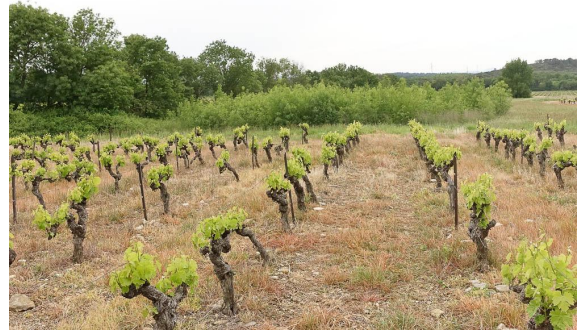
Reprise de Frêne dans une friche.