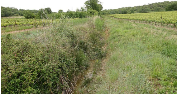
Vue générale en contexte agricole.