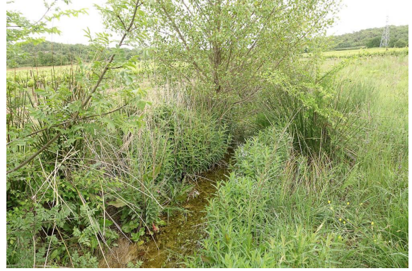
Végétation des ourlets de cours d'eau (Grande Salicaire.).