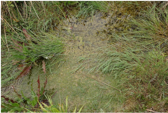
Tapis de characées.