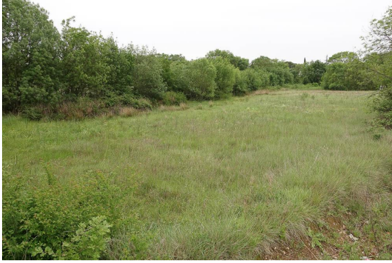
Prairie "humide", entre un cordon de frênes et le fossé de la route.