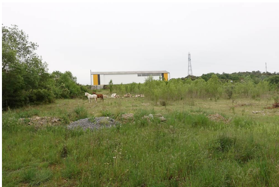
En rive gauche, la frênaie gagne dans le vallon.