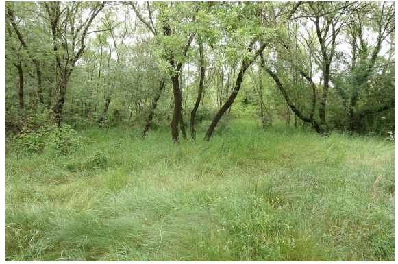
Frênaie entretenue (loisir).