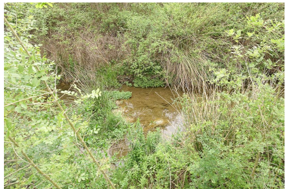
Secteur plus ensoleillé.