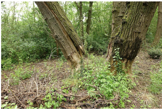
Intervention du Castor...