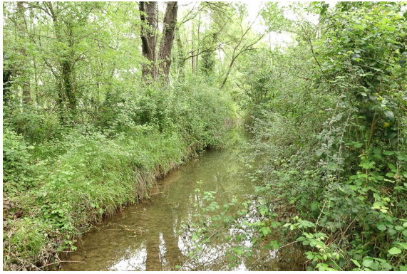
Vue générale de la ripisylve à Frênes sur le cours d'eau.