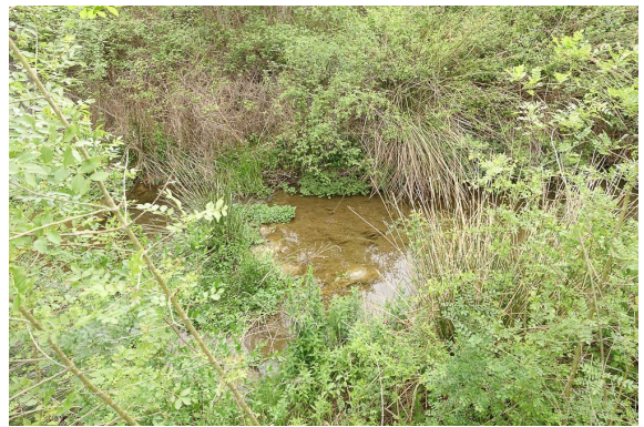
Secteur plus ensoleillé.