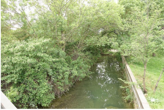
Frênaie sur cours d'eau canalisé.