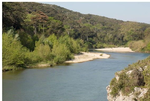
Vue générale montrant la faible emprise de la ripisylve.