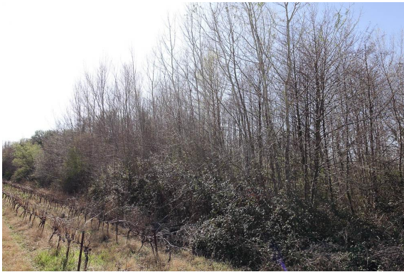
Belle ripisylve d'Aulnes et Peupliers blancs.