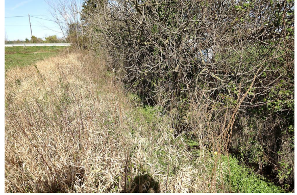
Le lit du ruisseau, en amont de la ripisylve, est bien végétalisé.