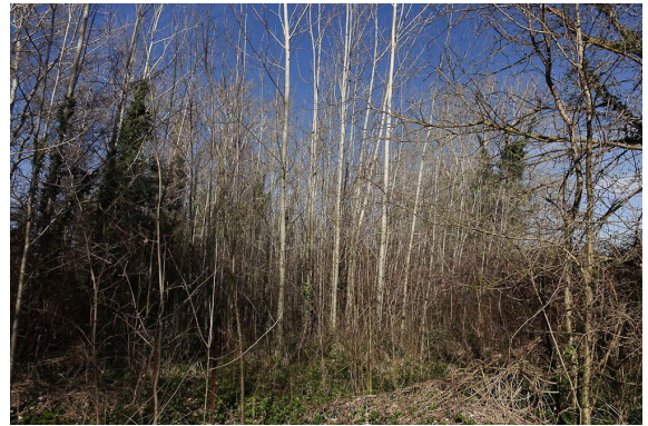
Jeunes Peupliers blancs.