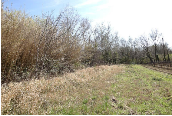
Cannier, merlon (protection de la parcelle agricole) à Phalaris arundinacea .