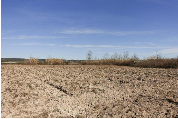
La zone humide est fortement contrainte par l'activité agricole.