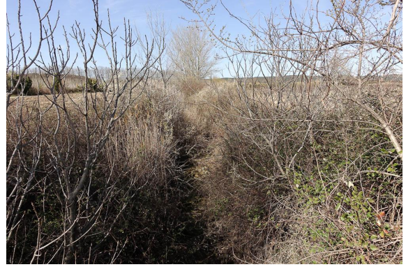
Quelques Phragmites se développent dans le lit asséché du ruisseau.