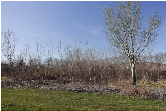
Petit bosquet de Peupliers blancs et Frêne en reprise.