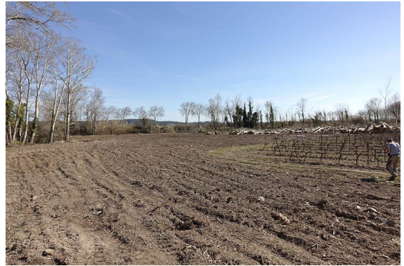
Là, il y avait une belle ripisylve à Peupliers blancs. C'est propre...