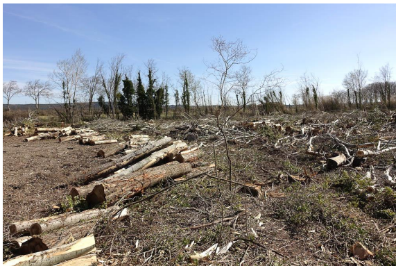
Les Peupliers blancs sont encore là... débités en morceaux.