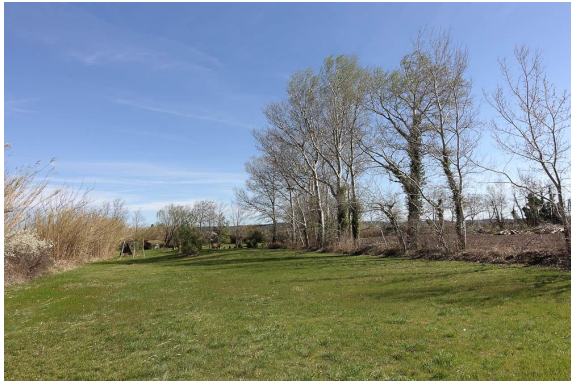
Belle prairie (mésophile) bordée de Cannier et de Peupliers ; tout au bout s'écoule le ruisseau de Larrière.