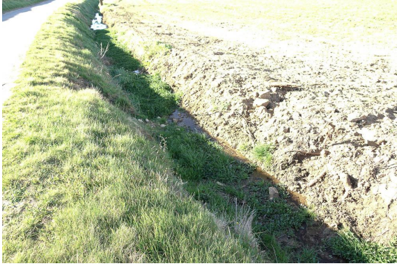
Fossé à Cresson.