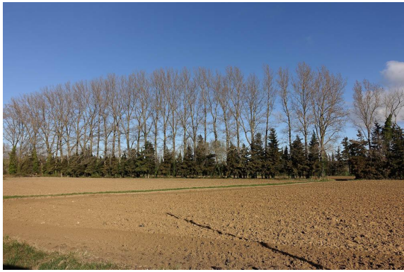
Ripisylve plantée de grands Peupliers noirs doublant les haies de Cyprés.