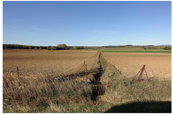
Vue générale de la zone.