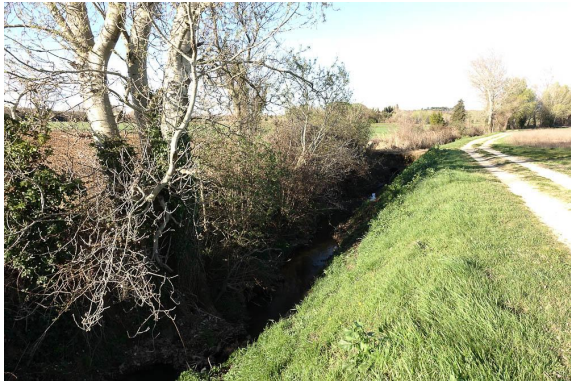
Ripisylve étriquée sur fossé agricole.