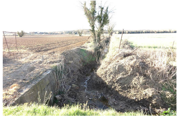
Ripisylve mise à mal par l'aménagement des fossés.