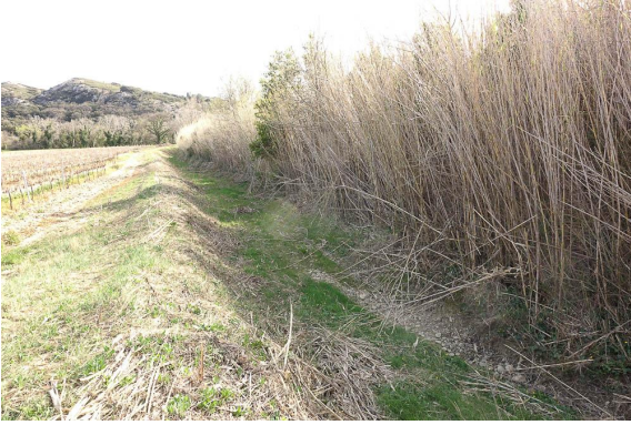
Cannier de Provence dans la partie aval.