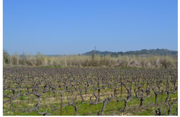
Cannier sur berges cours d'eau canalisé et incisé.