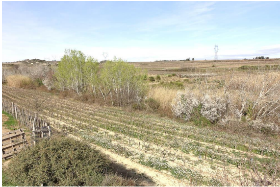
Vue globale sur la ripisylve à Peuplier blanc fortement contrainte par l'activité agricole de part et d'autre.