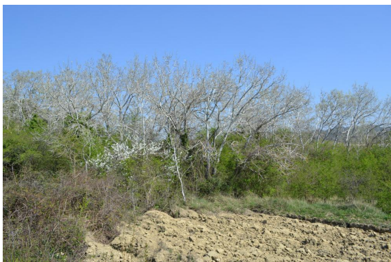
Ripisylve dominée par le Peuplier blanc.