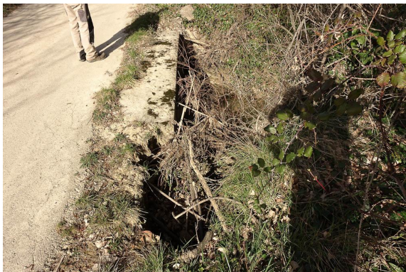
Détail de l'érosion au niveau du pont médian.