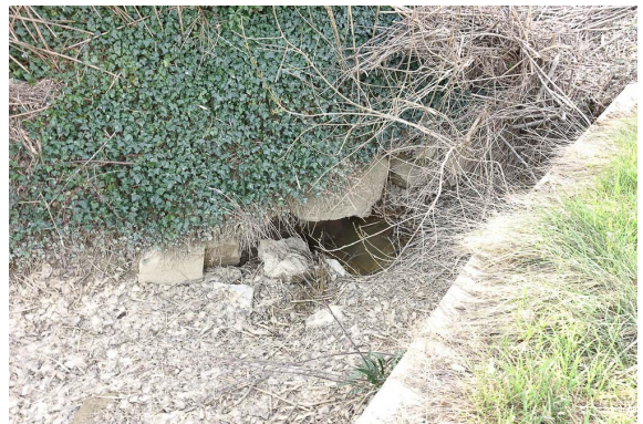
Détail de l'érosion au niveau du pont aval.