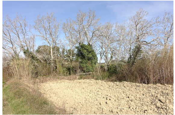
Détail d'activité agricole limitant fortement l'extension naturelle de la ripisylve, et affaiblissant son état global de conservation.