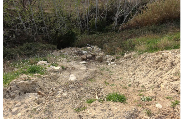
Détail de la pression de l'ancienne décharge.