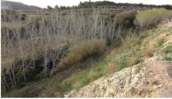
Vue générale du cordon de Peuplier blanc.