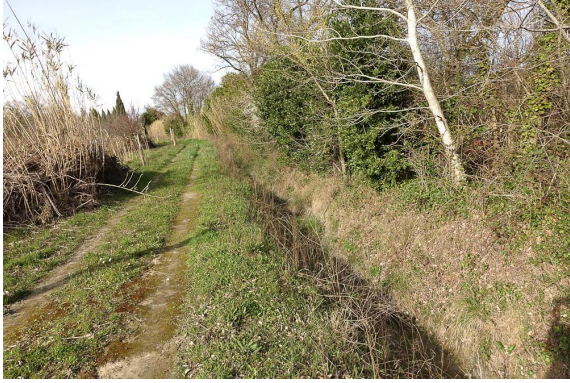
Chemin et fossé longeant la ripisylve à Peuplier blanc.