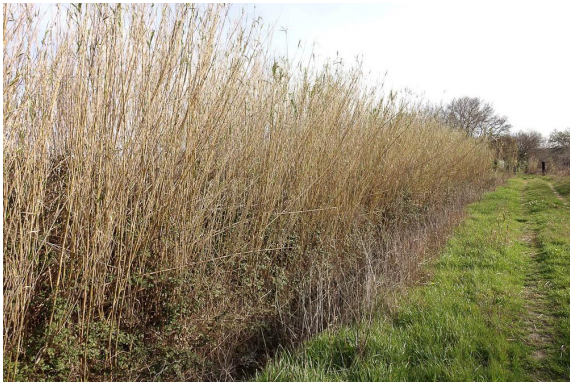
Canne de Provence en haie.