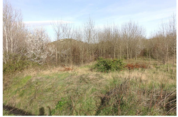
Frênaie en reprise dynamique sur culture abandonnée.