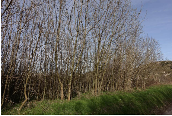
Régénération dense de Frêne/.