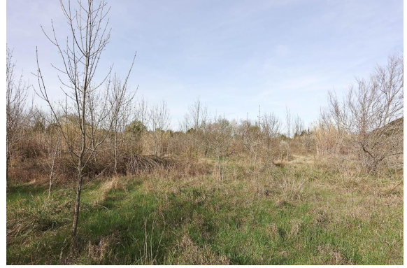
Reprise de Frêne sur ancienne pâture.