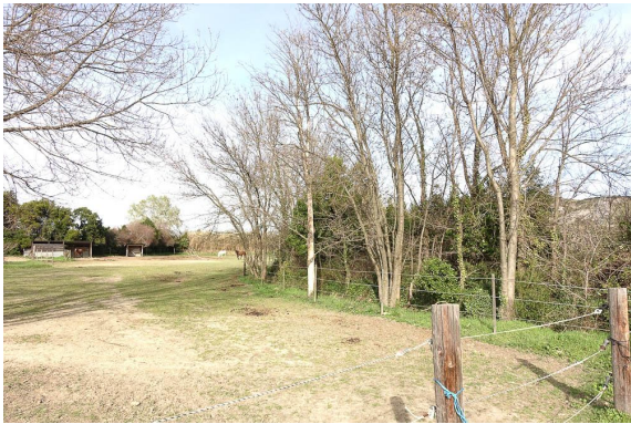
Pâtûre à chevaux au coeur de la ripisylve.