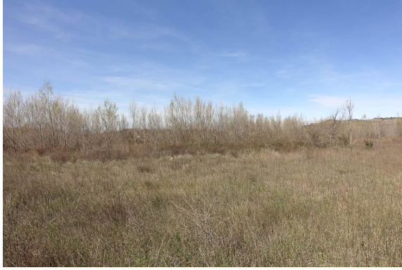
Reprise de Frênes et Peupliers autour d'un tas de remblais conséquent.