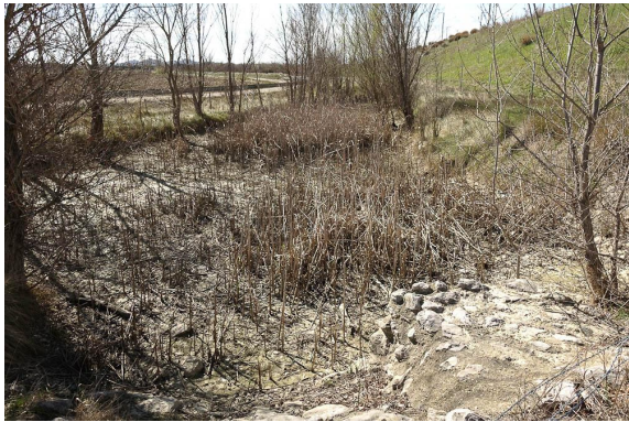
Bassin d'orage du TGV, végétalisé par des Typha et Symphyotrichum subulatum var. squamatum.