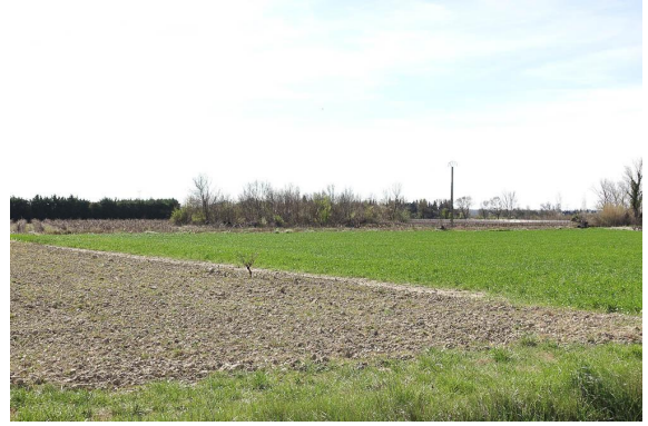
Bosquet de Frênes complètement isolé au milieu de la zone agricole.