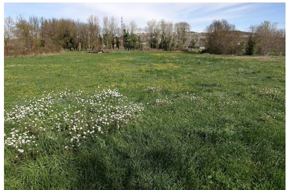
Prairie pâturée bien verte, mais non caractéristique des zones humides (sondage).