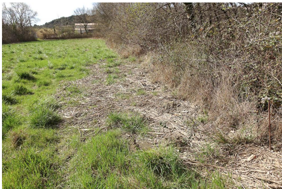
Laisses de crues dans les prés : indication d'une certaine rétention d'eau.