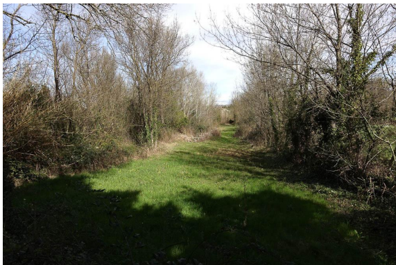
Autre prairie à fort potentiel d'humidité.