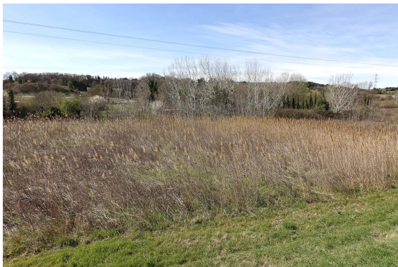
Roselière "sèche" en reprise sur d'anciennes cultures, déconnectée du Briançon par la digue.