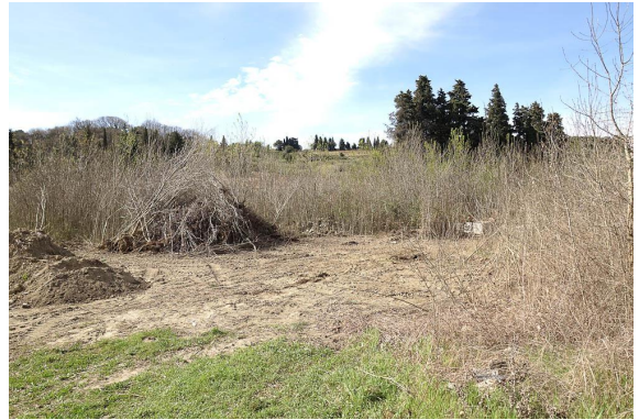
Cours d'eau entretenu, très incisé (> 2m).