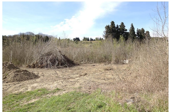
Reprise de Frênes vite réfrénée en pied de coteau.