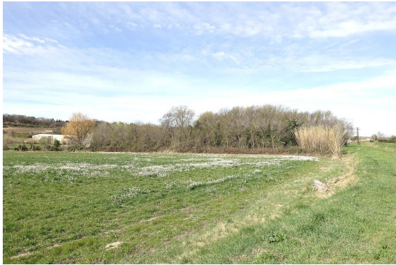
Vue depuis la RD500.