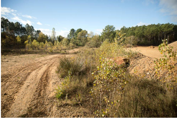
Végétation hygrophile dans un contexte post-industriel.