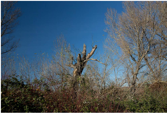
Peuplier mort dans la ripisylve.