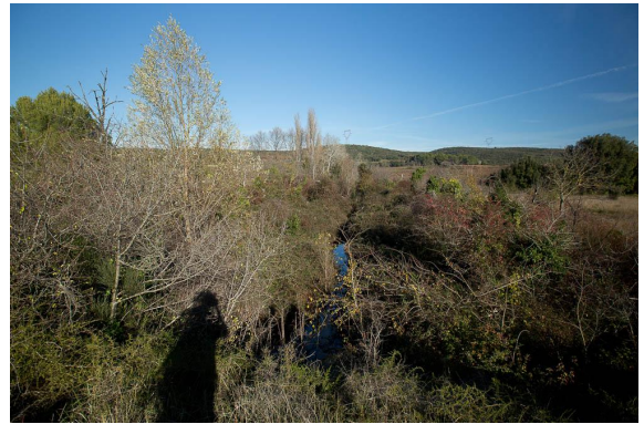
Vue depuis la voie ferrée sur la ripisylve éparse à Peupliers blancs.