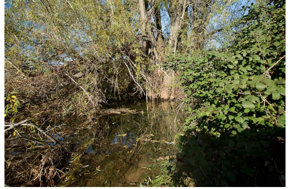
Cours d'eau alimenté au pied du grand Saule blanc en amont.