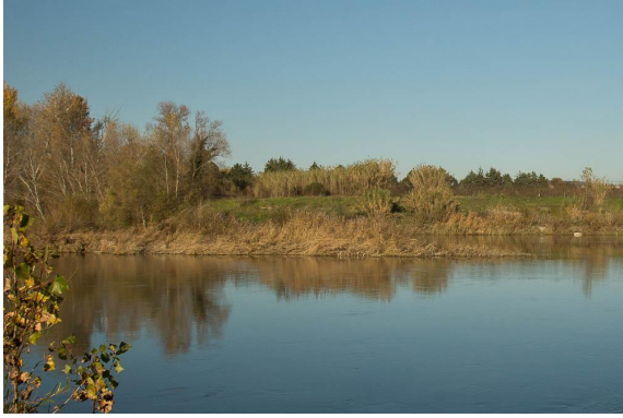
L'îlot est peu visible devant la ripisylve de la rive gauche.