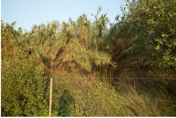
Cannes de Provence.