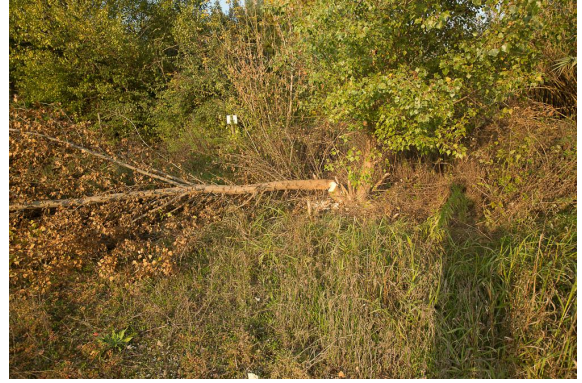
Peuplier noir coupé par un Castor.