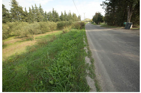
Zone à Helosciadium nodiflorum accueillant l'Agrion de Mercure.