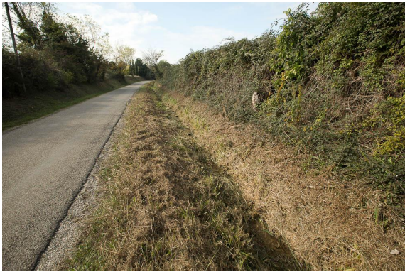
Tronçon amont fauché.