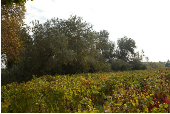
Bosquet de Peupliers blancs sur le talus des Costières.