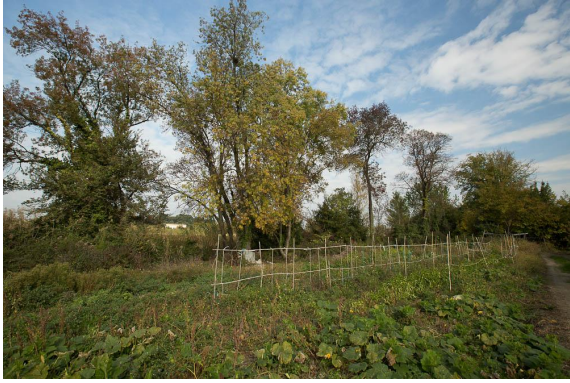
Vue de la ripisylve éparse.