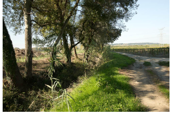
Vue du fossé.