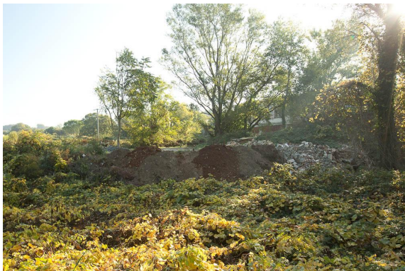
Remblai en prolongement d'un terrain individuel.