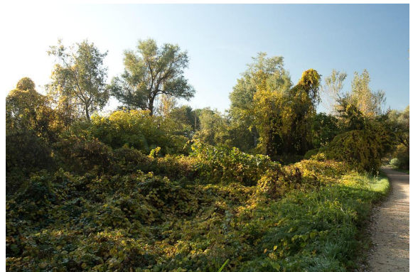
La vigne "sauvage" envahit fortement les friches comme les plus grands peupliers.