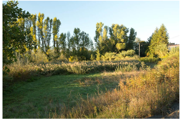
Roselière et alignement de Peupliers noirs en contrebas de la zone urbaine.