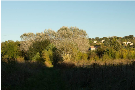
Bosquet de Peupliers blancs en lisière de zone urbaine.