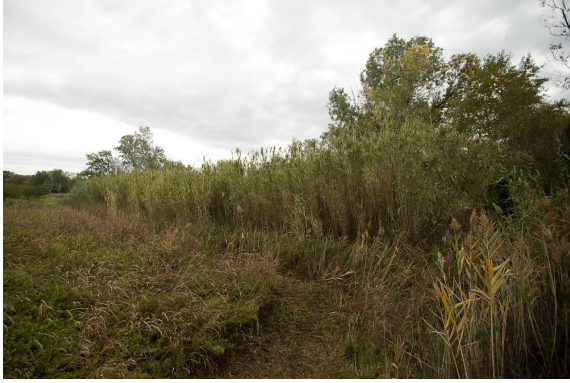
Cannier bordant le côté amont de la frênaie.