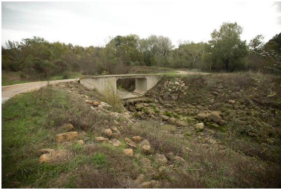
Pont sur le cours d'eau incisé, artificialisé avec affouillement en aval.