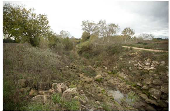
Vue de la ripisylve très dégradée dans la partie aval.