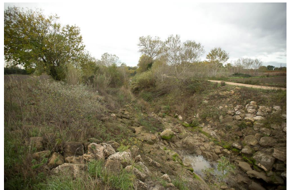
Vue de la ripisylve très dégradée dans la partie aval.