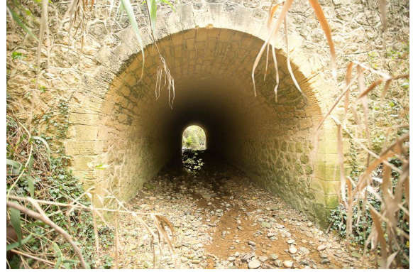
Le pont sous la voie ferrée en amont.