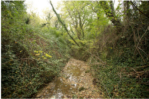
Vue depuis le cours d'eau incisé, vers l'aval.