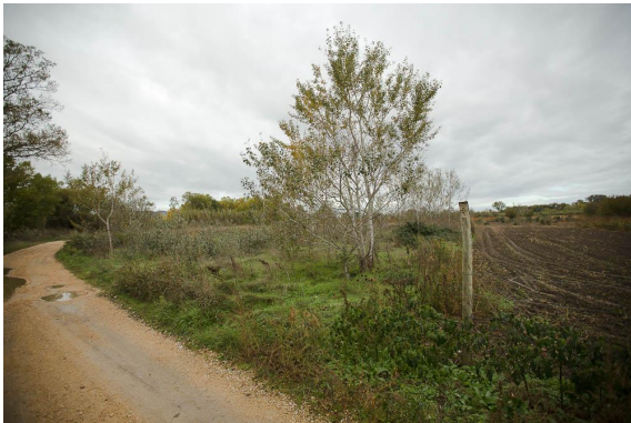
Reprise de Peupliers blancs dans une friche attenante à la ZH 3096.