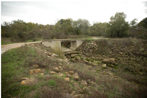
Pont sur le cours d'eau incisé, artificialisé avec affouillement en aval.