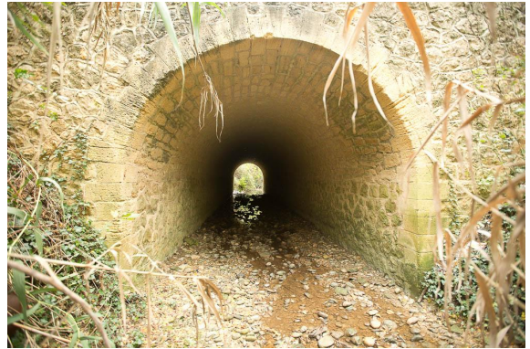
Le pont sous la voie ferrée en amont.