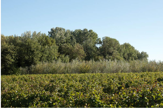
Belle ripisylve et reprise dynamique de Peupliers blancs.