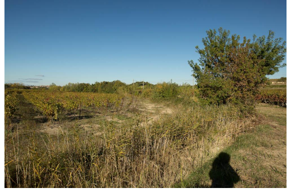
La roselière est bien développée en amont.