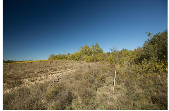
Les peupliers sont perchés dans la pente argileuse.