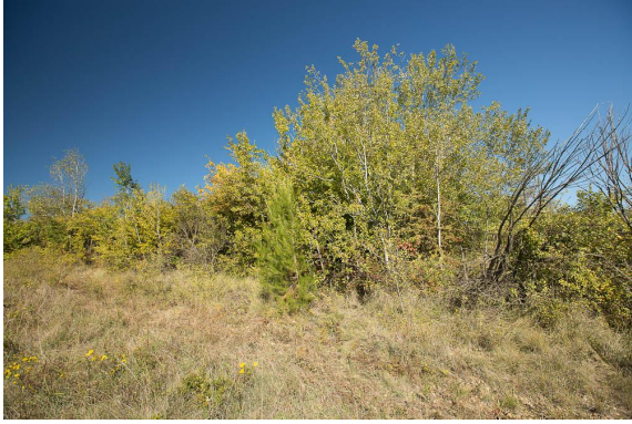
Peupliers émergent dans le paysage de vignes et garrigue.